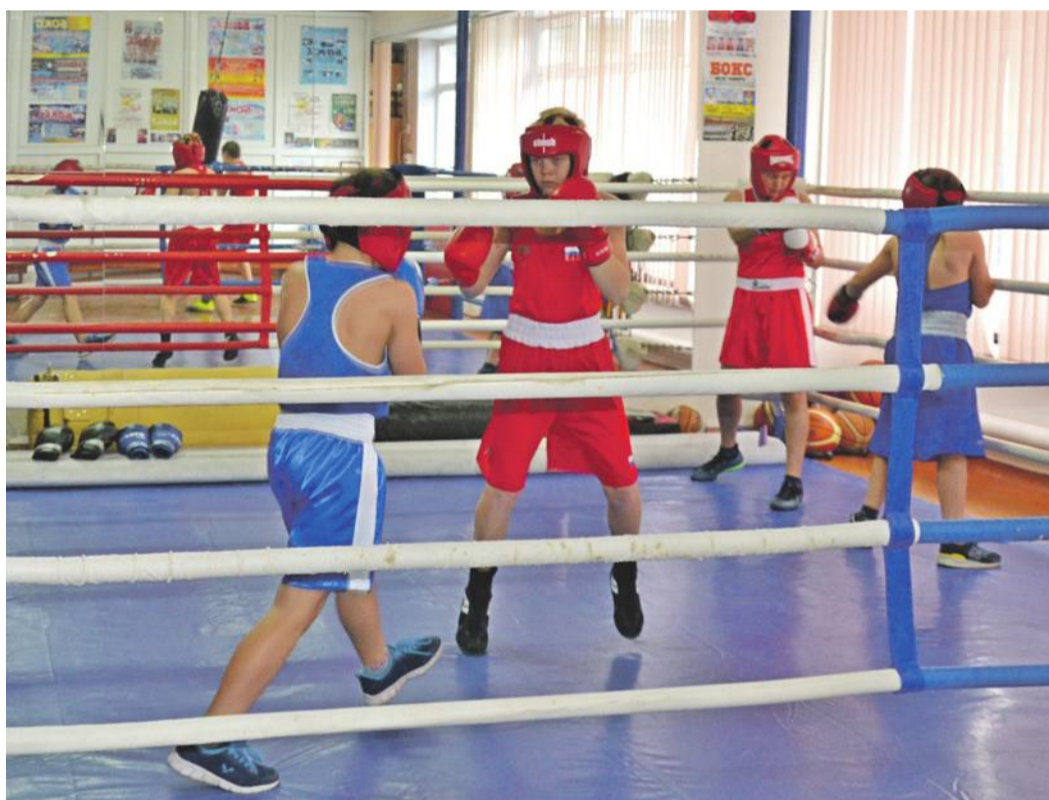
Тренировки по боксу в школе № 4