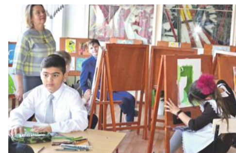
В изостудии школы № 4