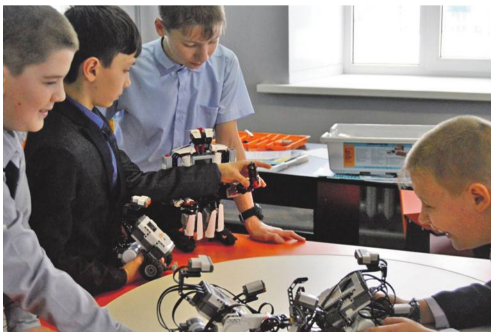
Технопарк в школе № 1

Ещё один важнейший элемент современной инфраструктуры — создание цифровой образовательной среды. Для решения проблемы взаимоотношений «цифровые ученики и нецифровые» учителя создали школьный медиацентр «МедиаДикт».