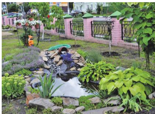
Ландшафтный дизайн на территории школы № 2