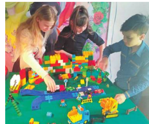
Студия мультипликации в Доме детского творчества