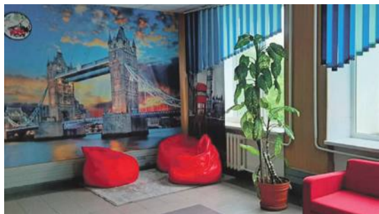
Рекреационная зона в школе № 1