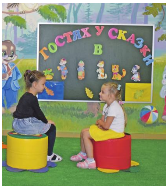
В детском саду № 4