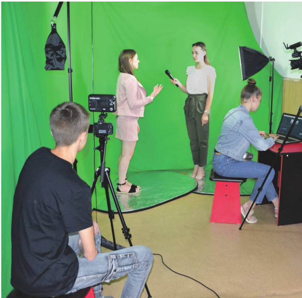
В школьном медиацентре «МедиаДикт» школы № 1