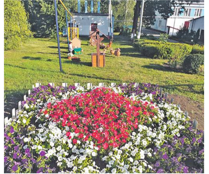
Старобезгинская школа Новооскольского городского округа