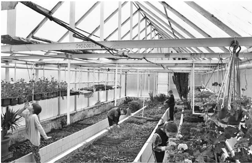
Школа имеет учебно-опытный участок площадью 0,75 га, где выращивают овощи и фрукты. В теплице зимой — зелень, весной — саженцы цветов

класса с современным оборудованием, шесть логопедических кабинетов, комната психологической поддержки, вокальная студия, спортивные и игровые площадки.