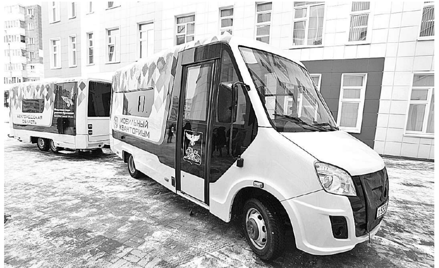
Мобильный технопарк «Кванториум»

КАК МОБИЛЬНЫЙ «КВАНТОРИУМ» ПОМОГ ОХВАТИТЬ ДОПОБРАЗОВАНИЕМ ТЕХНИЧЕСКОЙ НАПРАВЛЕННОСТИ УЧЕНИКОВ СЕЛЬСКИХ ШКОЛ