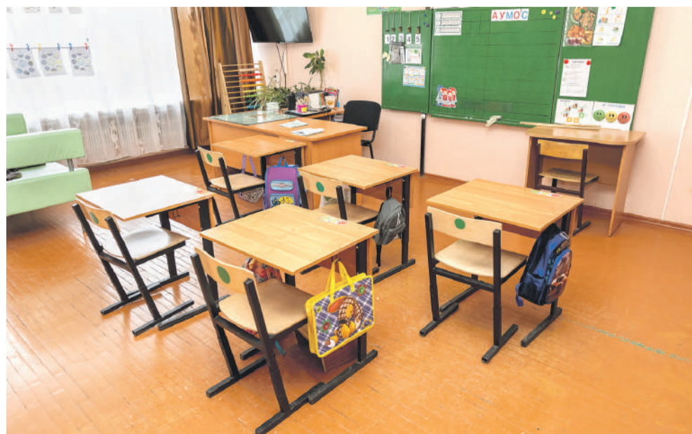
Класс для учеников с тяжёлыми интеллектуальными отклонениями

Слово «социализация» — слишком серьёзное, безликое, официальное. Но означает оно очень многое. Фактически — всю жизнь ребят в школе-интернате. Многие «особенные» дети совсем по-другому