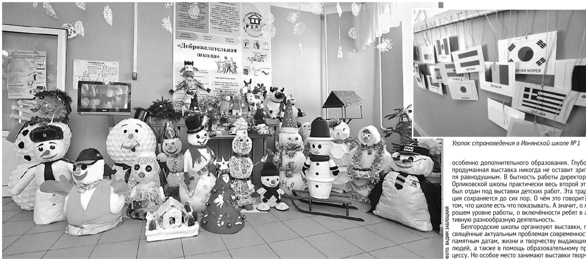
Оформление стен и рекреаций Гостищевской школы Яковлевского округа создаёт новогоднее настроение