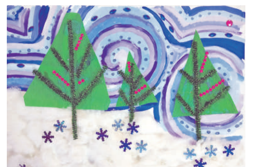
Коллективная работа объединения «Бумажные фантазии»