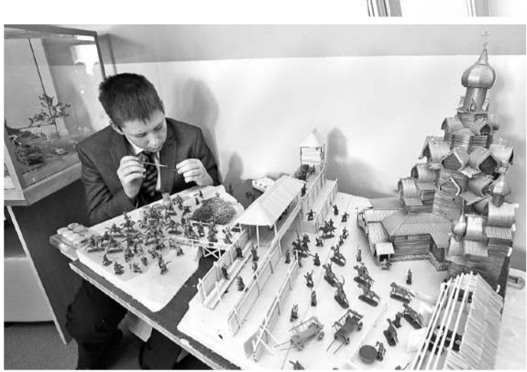
Вот такой макет старинной крепости ребята сделали своими руками