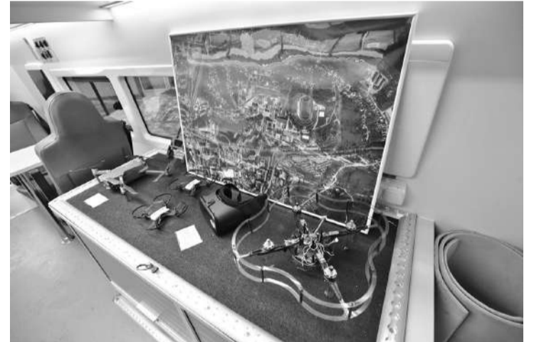
Мобильный «Кванториум» «начинён» современным оборудованием

Передвижная лаборатория с высокотехнологичным оборудованием с сентября колесит по шести муниципалитетам региона: Яковлевскому и Шебекинскому округам, Белгородскому, Борисовскому, Корочанскому и Прохоровскому районам.