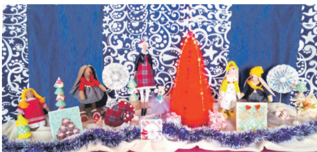
Подделки ребят из объединения «Умелые ручки»