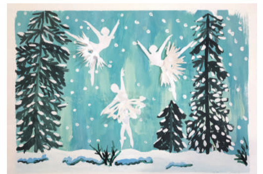
Коллективная работа объединения «Бумажные фантазии»