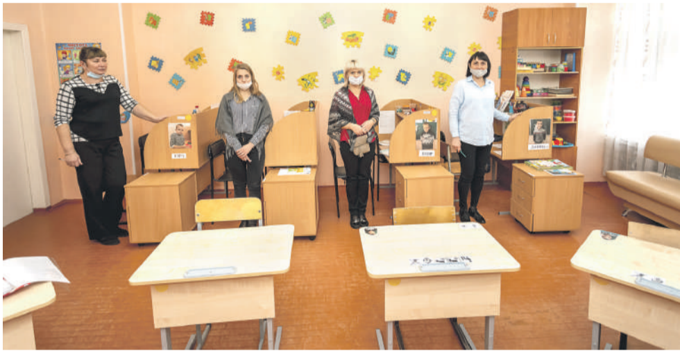
Тьюторы: каждый занимается с одним ребёнком с самыми тяжёлыми проблемами со здоровьем