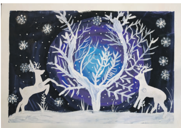
«Зимняя сказка». Рисунок Алексея Чудных (руководитель Дина Кислиця)