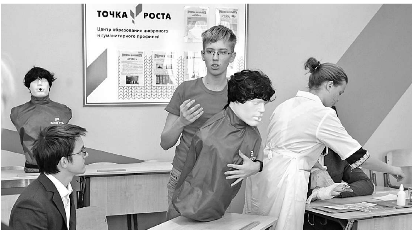
Оказывать первую помощь пострадавшим школьники учатся на манекенах-тренажёрах