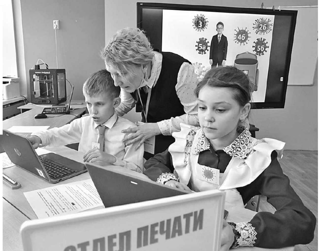
Отделу печати поставлена задача: найти информацию по профилактике коронавируса