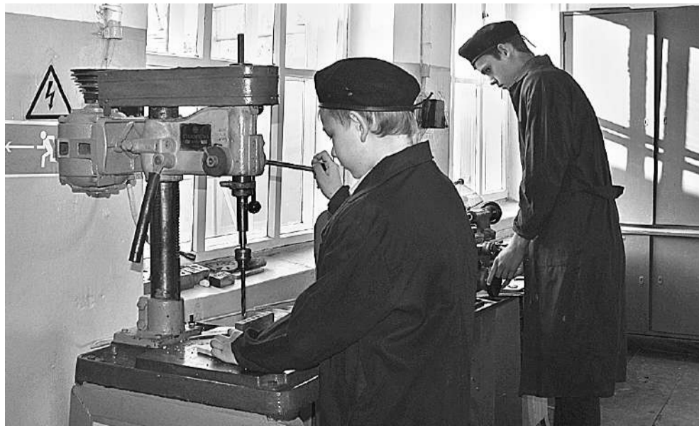
В школьной мастерской мальчишки учатся столярному и слесарному делу