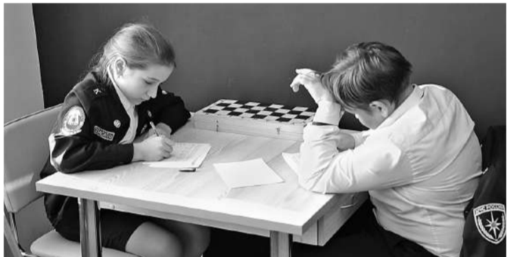
Рассчитать ценность шахматных фигур — задача нелёгкая