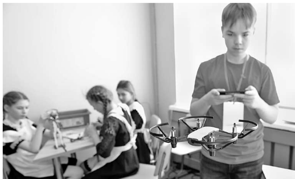
Запуск квадрокоптеров — любимое занятие мальчишек