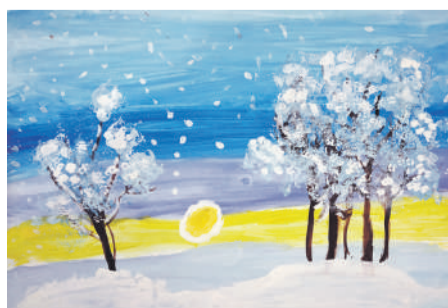
«Снег». Рисунок Юрия Кривокустава (руководитель Дина Кислиця)