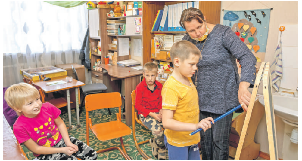
Творческие занятия на внеурочке