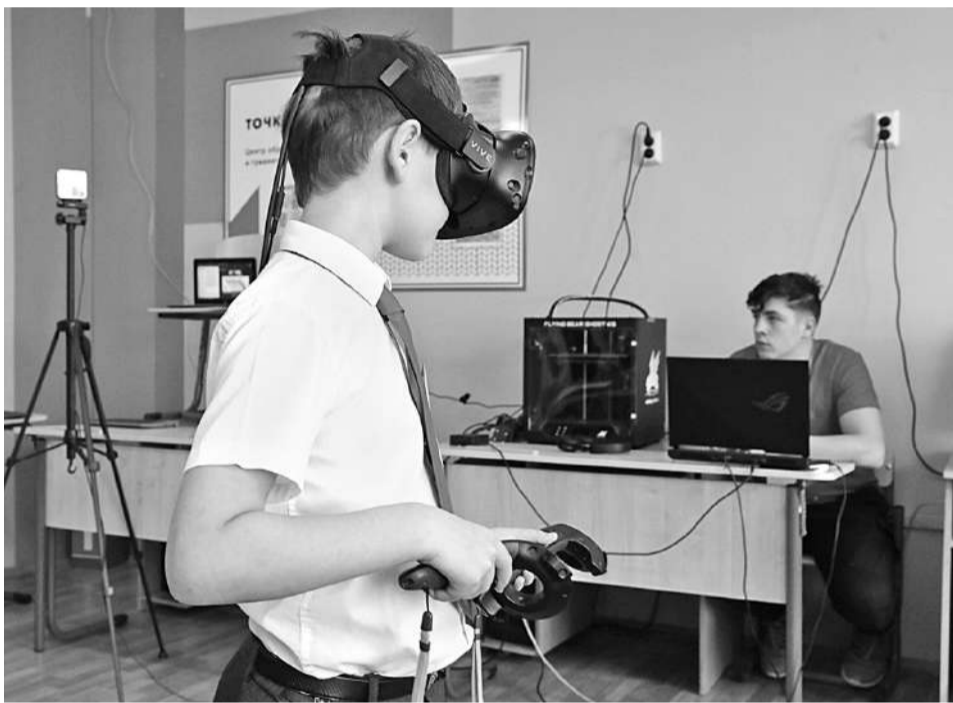
Путешествие вглубь лёгких с помощью очков виртуальной реальности

Старшеклассники Гостищевской школы раз в неделю на математике занимаются на платформе «Учи.ру». На внеурочке этот ресурс тоже активно используется. Нам показали одно из таких занятий: школьники выполняли на ноутбуках задания пробного тура олимпиады Vicsmatch.com+.