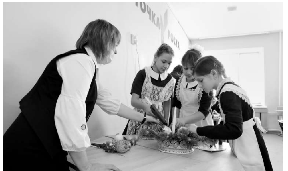
Девчонки из кружка «Станем волшебниками» за несколько минут создали новогоднюю композицию