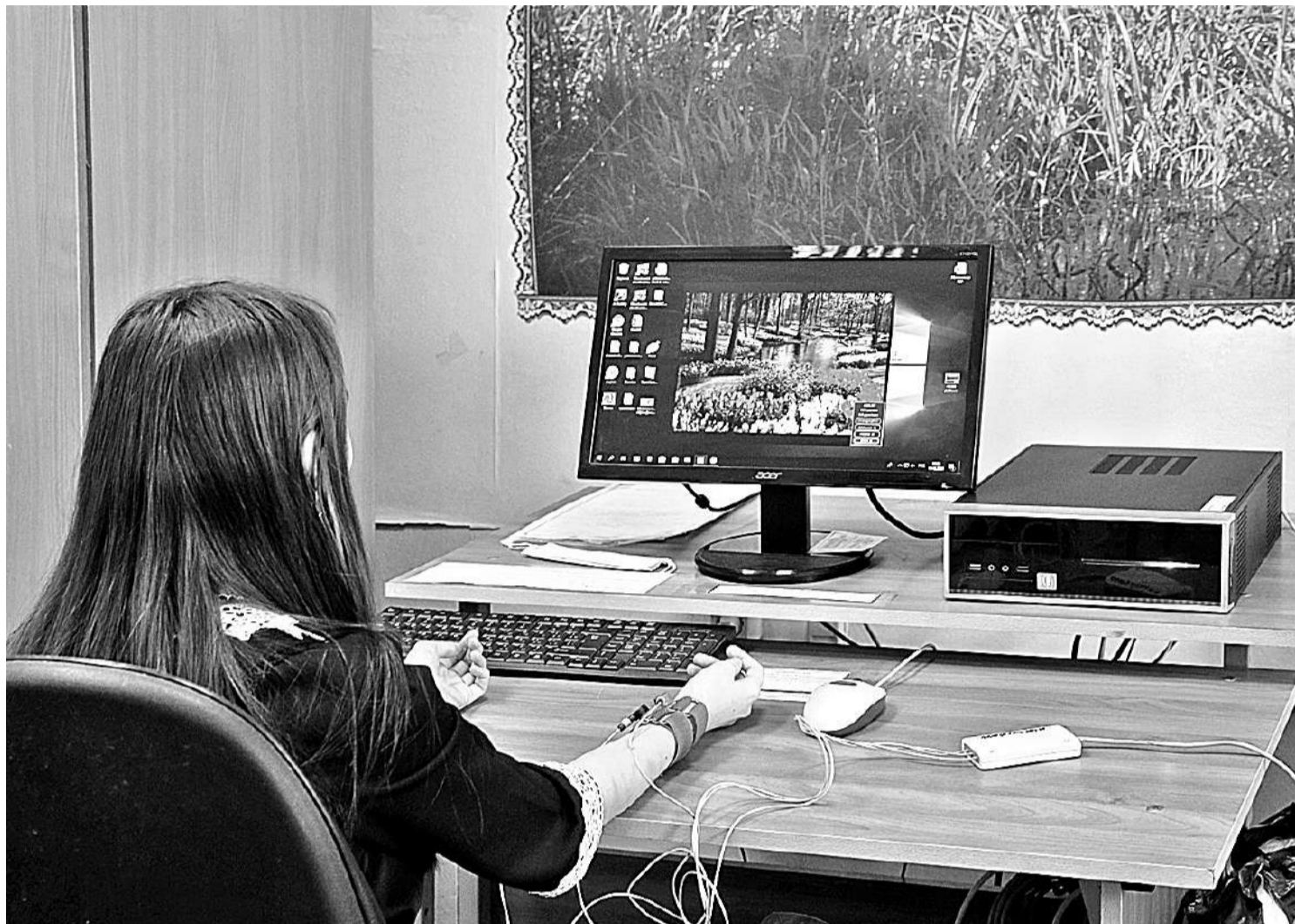
На занятии в кабинете БОС-здоровье

КАК КОРОЧАНСКАЯ ШКОЛА-ИНТЕРНАТ ДАЁТ ПУТЁВКУ В ЖИЗНЬ ДЕТЯМ С НАРУШЕНИЯМИ РЕЧИ