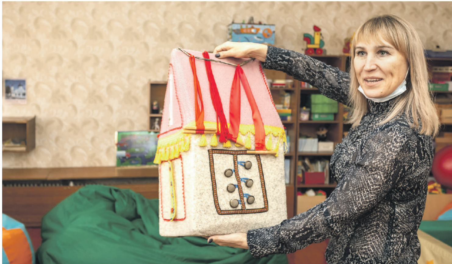
Оборудование для развития мелкой моторики

ПОЧЕМУ В НОВООСКОЛЬСКОЙ ШКОЛЕ-ИНТЕРНАТЕ РЕБЯТАМ ХОРОШО ТАК ЖЕ, КАК ДОМА