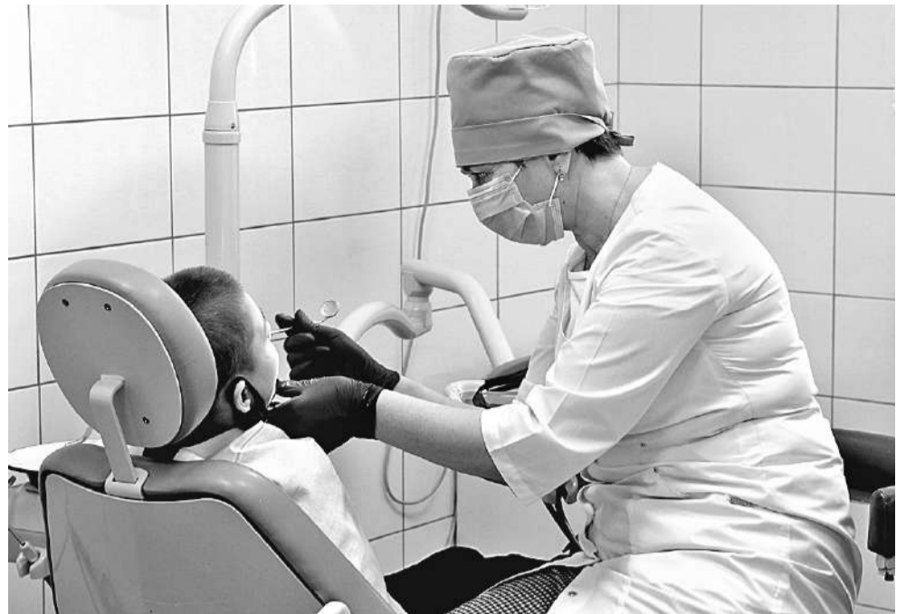
В лечебно-оздоровительном комплексе Корочанской школы-интерната оборудован стоматологический кабинет

Все дети в Корочанской школе-интернате с сохранным интеллектом, так что проблем с их социализацией нет. Но чтобы лучше подготовиться к взрослой жизни, участвуют в проекте «Уроки финансовой грамотности», а в рамках школьной программы на уроках технологии девочки учатся швейному делу (могут они и приготовить несложные блюда: салаты, оладьи, блины...), мальчишки в мастерских — столярному и слесарному. Ученики 10–11-х