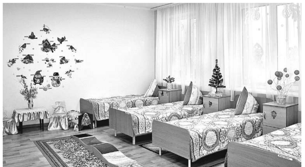
Спальная комната учеников начальных классов

классов ещё учатся в межшкольном учебном центре на водителей категории В.