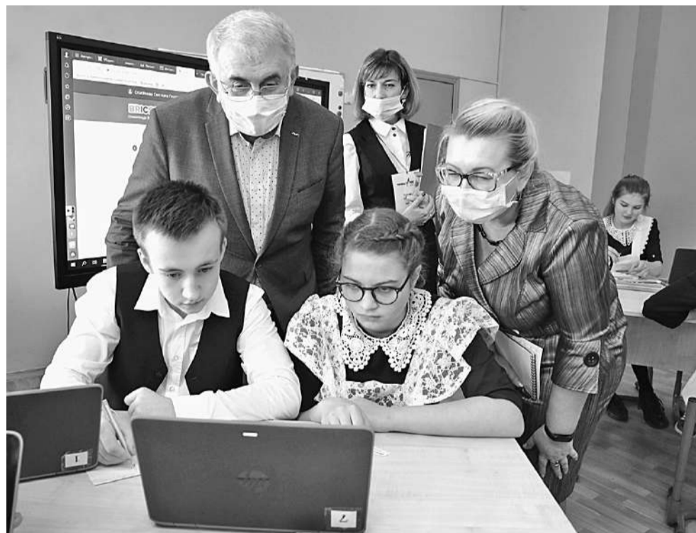
Решать олимпиадные задачи на платформе «Учи.ру» интересно и полезно!