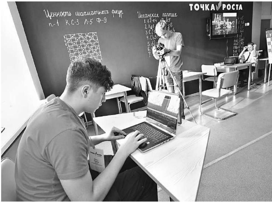
Школьная киностудия «Новое поколение»