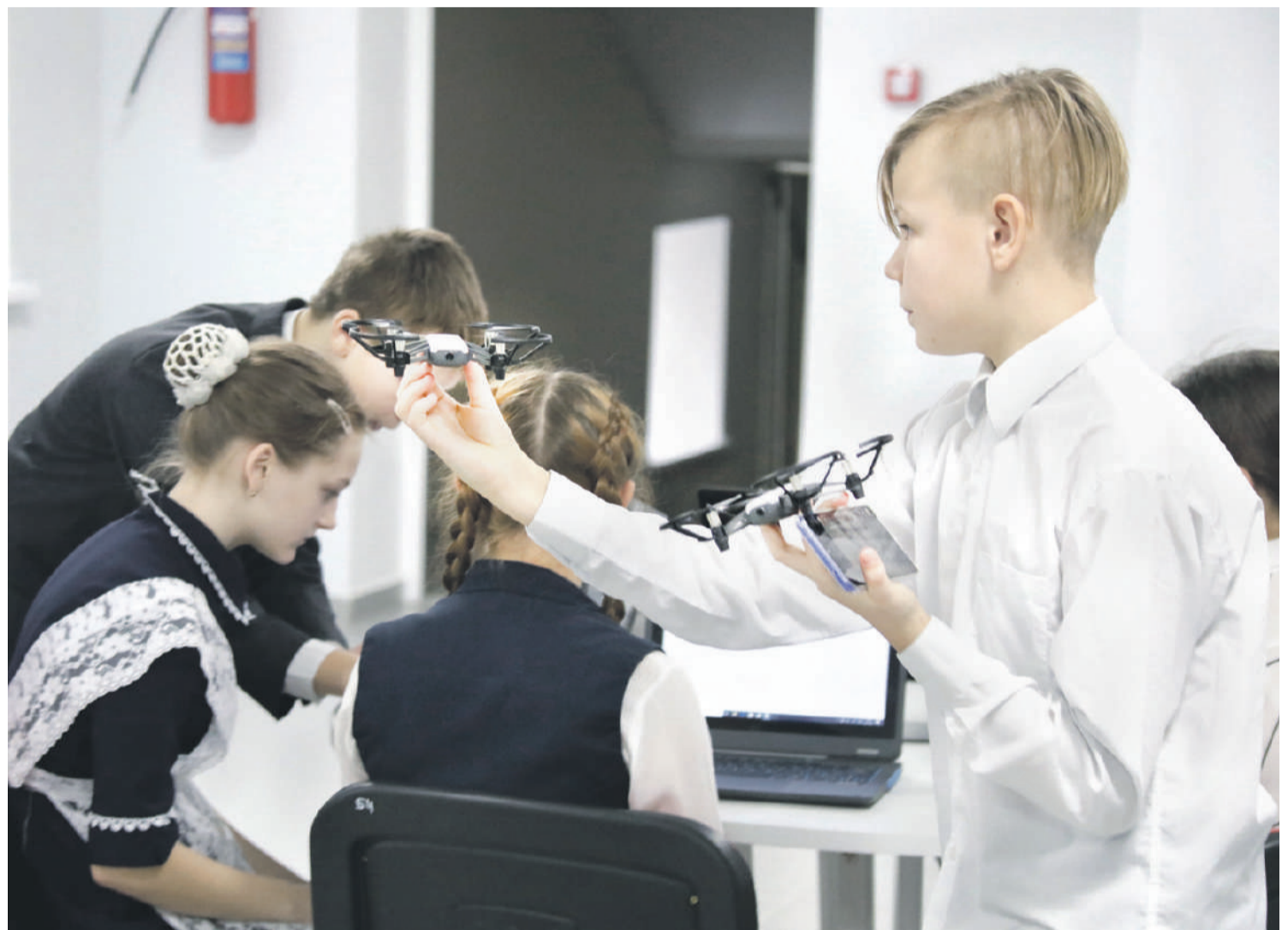
Квадрокоптерами сейчас даже в сельской школе никого не удивишь. С ними легко справляются в «Точке роста» Ровеньской школы № 2

На занятии внеурочной деятельности у младших школьников «Начинаем изучать английский язык» нам показали, как можно использовать флеш-карты (не компьютерные флешки, а карточки